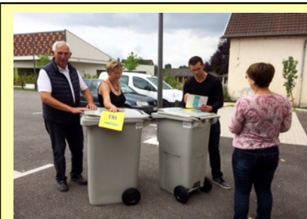
Distribution des bacs pour le tri des ordures ménagères

Achat d'un groupe électrogène pour les employés municipaux