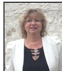
Christine Descollonges Maire de Vy-Lès-Lure

La crise du COVID à peine éloignée, la guerre en Ukraine éclate avec, pour tous, des contraintes budgétaires importantes. Et le réchauffement climatique est bien là ! Tous ces événements génèrent stress, mal-être et, chez certains de nos concitoyens, une agressivité envers les élus qui font pourtant leur possible pour rendre agréable la vie dans la commune.