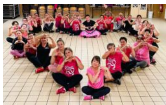
Octobre rose STEP007