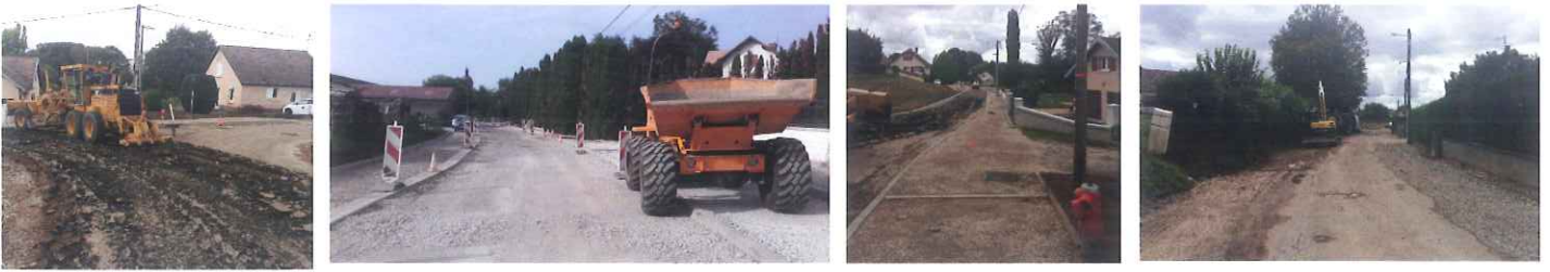
Aménagement de la rue de la Courbe.

Reprise du virage au carrefour des rues des Breuleux et des Maglères. Aménagement en cours de la rue St Léger et du chemin de la Vignotte.